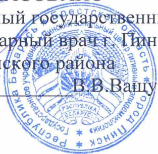
График комплексной промывки водопроводных вводов и внутридомовых сетей холодного водоснабжения жилых домов, находящихся на обслуживании КПУП «ЖРЭУ г.Пинска» на 2024 год